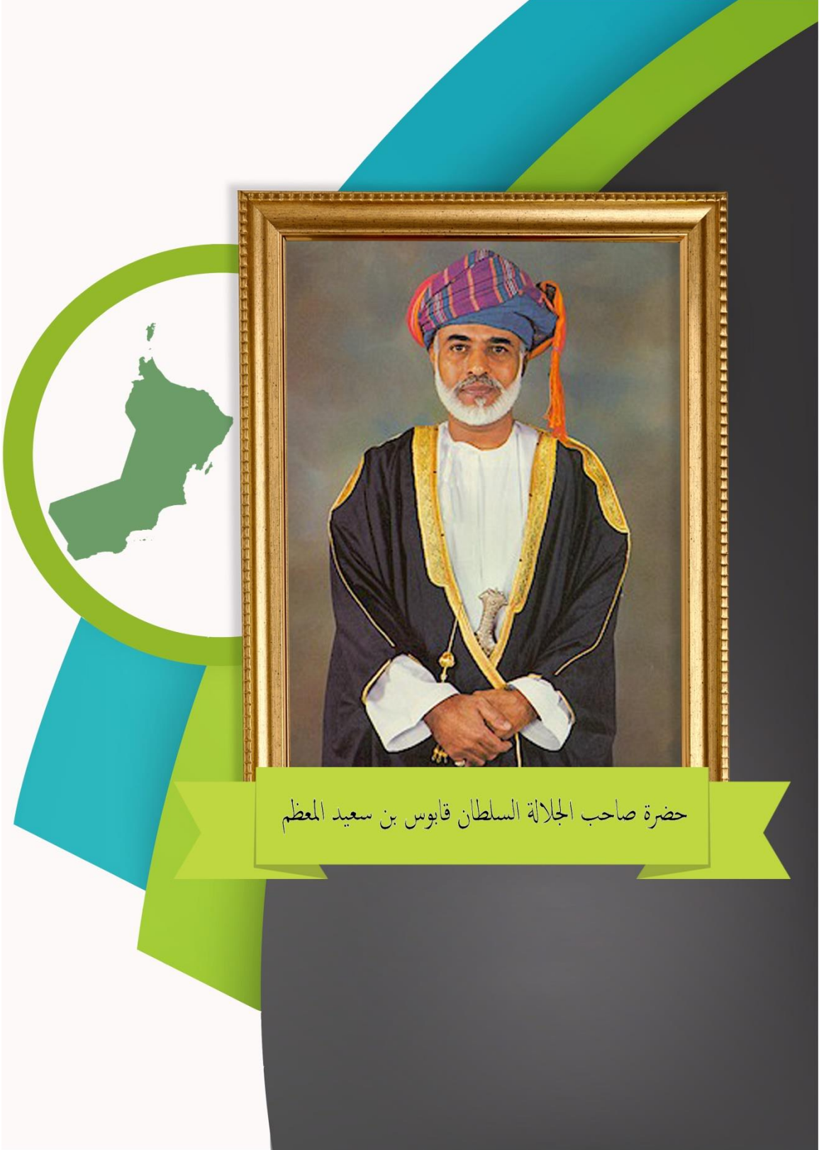
حضرة صاحب الجلالة السلطان قابوس بن سعيد المعظم